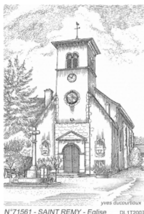
N°71561 - SAINT REMY - Eglise DL172007

Saint Rémy Patrimoine a pour vocation de faire connaître les richesses du patrimoine local. Pour cela, les Journées Européennes du Patrimoine qui se tiendront les 15 et 16 septembre 2018 sont une occasion à ne surtout pas manquer.