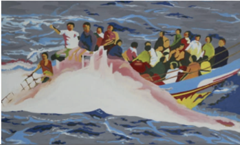
Les immigrants by Roland Serge Gnakabi, 2018 | Painting | Artsper