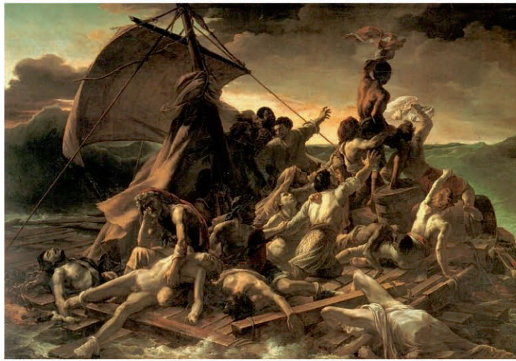
Le Radeau de la Méduse, Théodore Guéricault, 1818