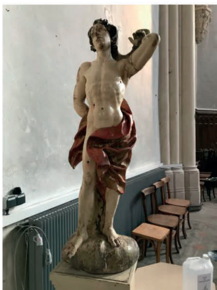
Statue de St Sébastien restaurée