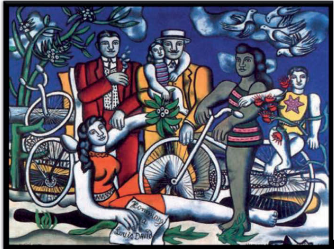
F. Léger – Les loisirs