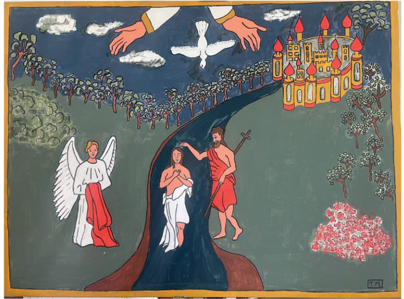
Le Baptême du Christ

Le baptême est le premier sacrement de l'initiation chrétienne. Il est une nouvelle naissance, signe de l'amour du Père. Le baptisé devient Fils de Dieu et membre du Peuple de Dieu : l'Eglise.